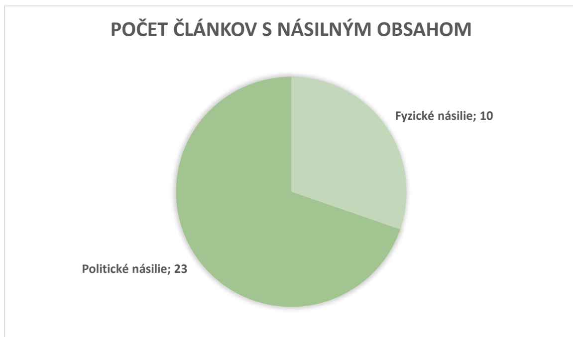
Obrázok 2 Štatistika článkov s násilným obsahom - portál Startitup