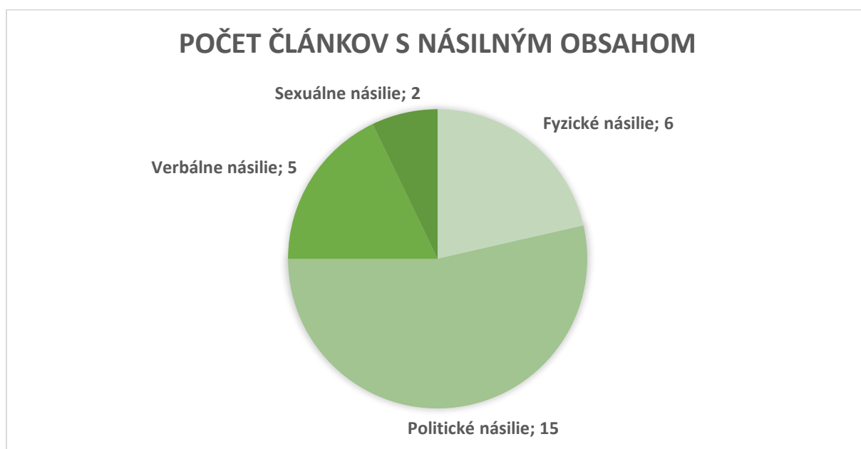
Obrázok 3 Štatistika článkov s násilným obsahom - portál Pravda