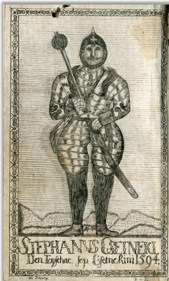
Obrázok 3 Frontispice Ladislava Bartolomeidesa

medirytine zanechal i autoportrét. Vo vlastivednom diele o gemerskom Štítniku je zachovaný jeho frontispice.