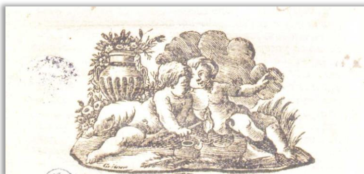
Obrázok 1 Typická Gritnerova vineta

Opätovne Gritnerovu grafickú tvorbu, nie však vlysy ale vinetu využil Tumler pri grafickej výzdobe učebnice gramatiky Františka Rosenbachera. 13 Tento atraktívny typ malej grafickej knižnej tvorby patrí medzi najbežnejší typ ornamentálneho, emblematického, kaligrafického alebo kombinovaného dekoru. 14