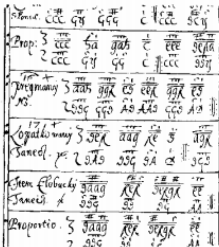
Obr. 2. Victorisova Tabulatúra

Na začiatku 18. storočia mali cirkevné piesne nevyhovujúcu žánrovú štruktúru a vo veľkej miere chýbali piesne k svätým, ako aj pohrebné piesne. Na území Slovenska nastal rozmach žánrov duchovnej piesne v podobe eucharistických piesni, alebo lamentov, avšak ich prítomnosť mala iba malé zastúpenie. Na území Slovenska existovalo niekoľko rukopisných spevníkov, ktoré sa rozširovali medzi katolíckymi veriacimi v viac-menej živelné, takmer bez podstatného zásahu oficiálneho kancionála. Na Slovensku v 18. storočí neboli uverejnené významné kancionálové tlače s notovanými nápevmi. 6