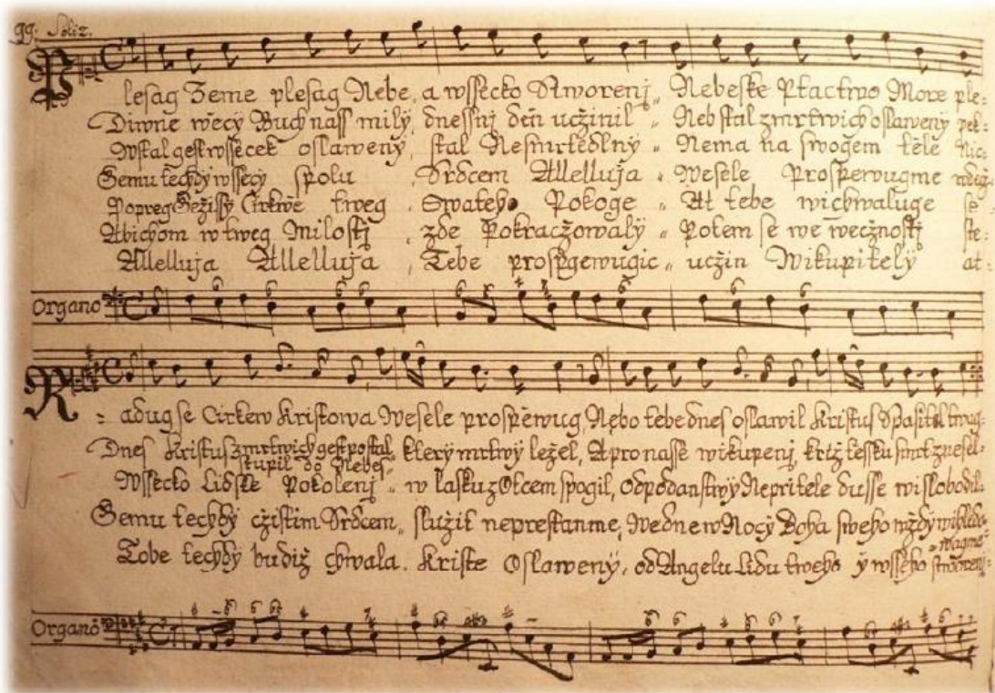
Obr. 3. Časť z kancionála Pavla Bajana (1786) s piesňou Raduj sa, Cirkev Kristova

Krátky exkurz katolíckou duchovnou piesňou je úvodom k širšiemu výskumu zameraného na komparáciu a analýzu duchovných piesní, ktoré sa stali súčasťou bohoslužobnej praxe i súkromnej pobožnosti na Slovensku.