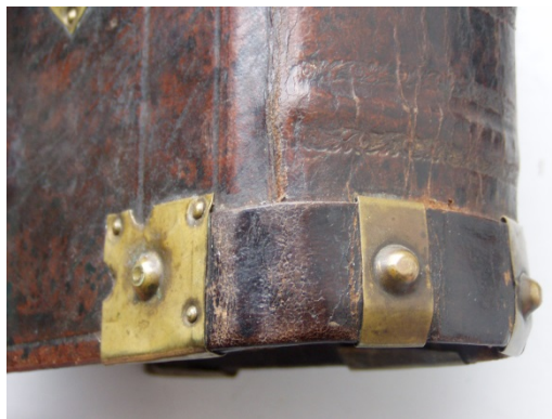
Chrbtové kovanie – typ 1