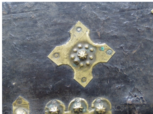
Puklica – ozdobná