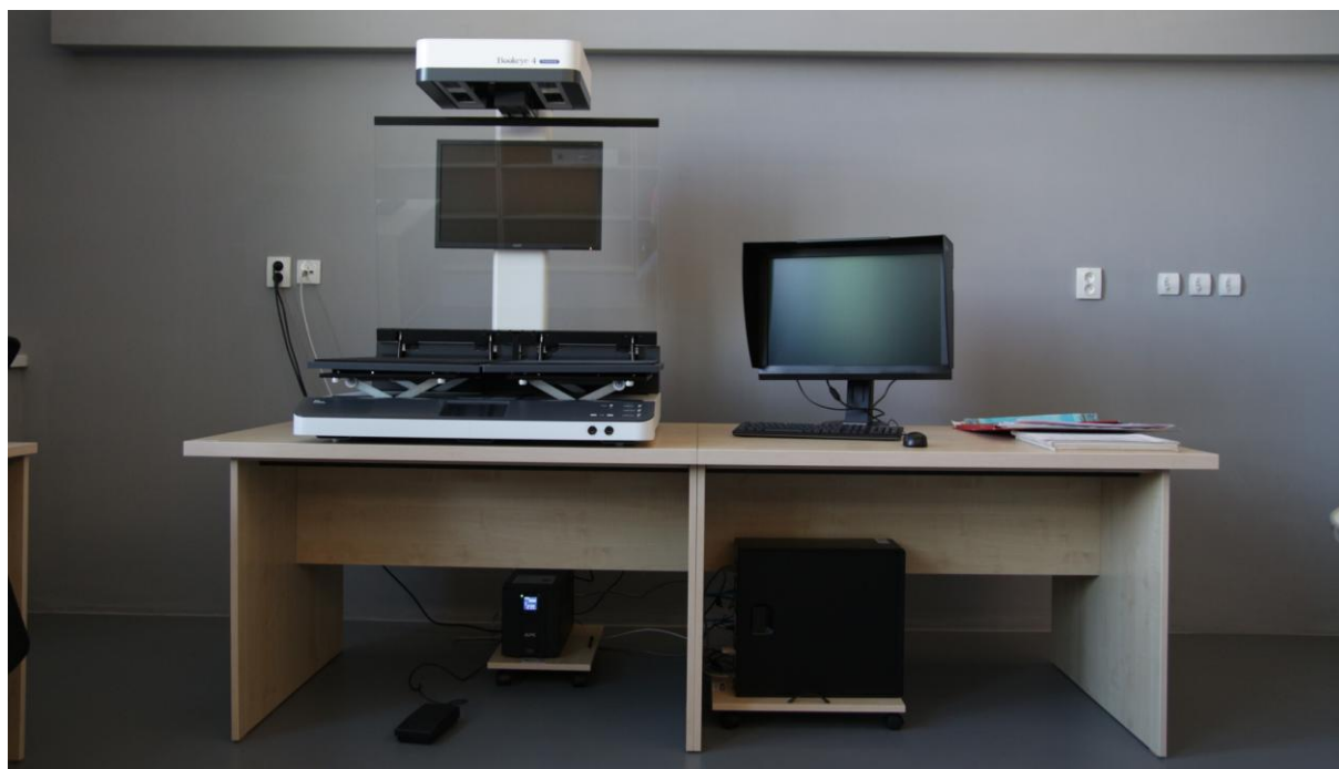
Obr. 6. Skener