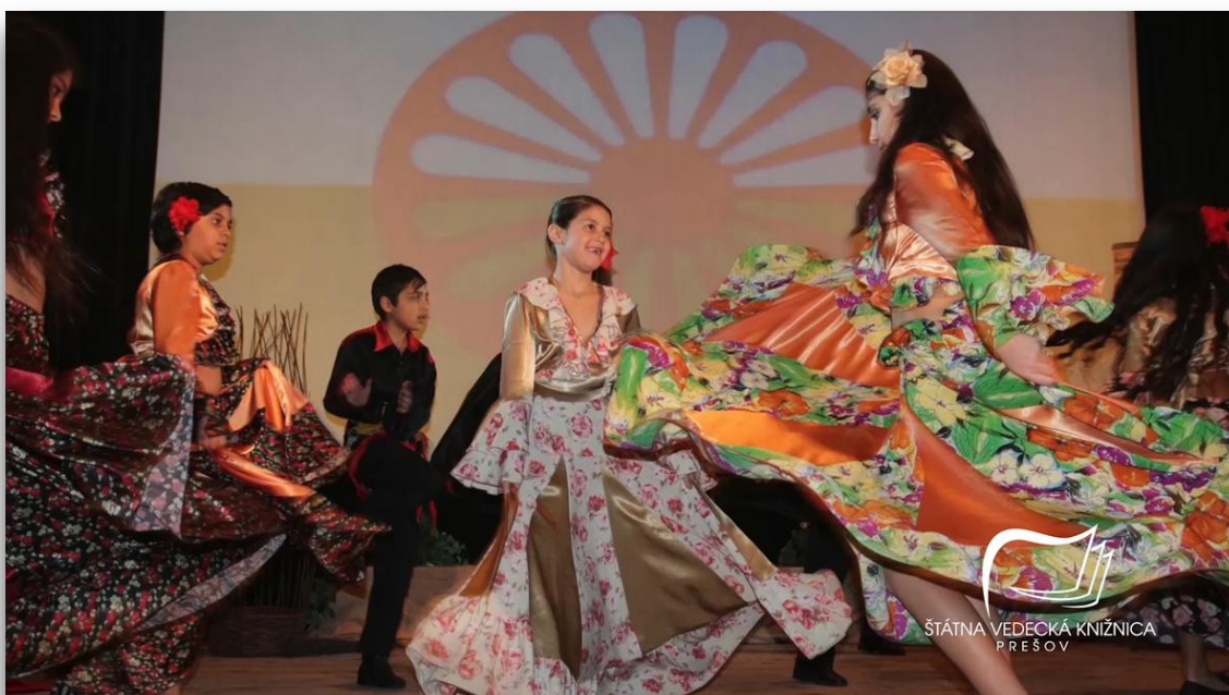
Obr. 8. Tanečný súbor Romano Jilo z Krupiny

Spolupráca interných zamestnancov a externých spolupracovníkov bola nastavená v zmysle opisu projektu tak, aby sa podarilo dosiahnuť čiastkové ciele a naplniť plánované výstupy mimo stanovených indikátorov. Táto spolupráca priniesla výsledky v podobe audionahrávok vytipovaných osobností pre spomienkové rozprávania, audio a videozáznamov rôznych individuálnych a skupinových speváckych, tanečných, hudobných vystúpení na koncertoch a festivaloch, divadelných predstavení a záznamov dokumentujúcich výrobné procesy remeselných výrobkov. Spolu bolo zaznamenaných 496 hodín audiovizuálnych záznamov, 56 hodín zvukových nahrávok a vyhotovených viac ako 20 000 fotografií.