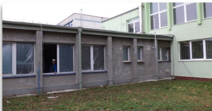
Obr. 2. Rekonštrukcia – exteriér