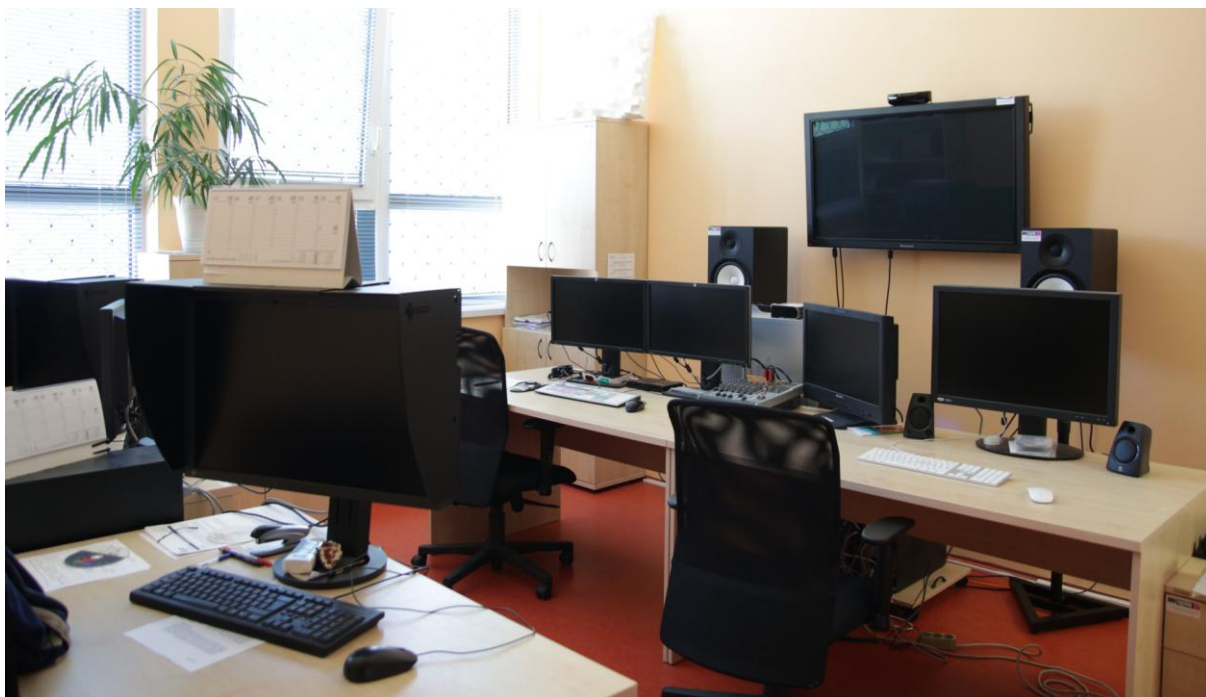
Obr. 3. Strižňa