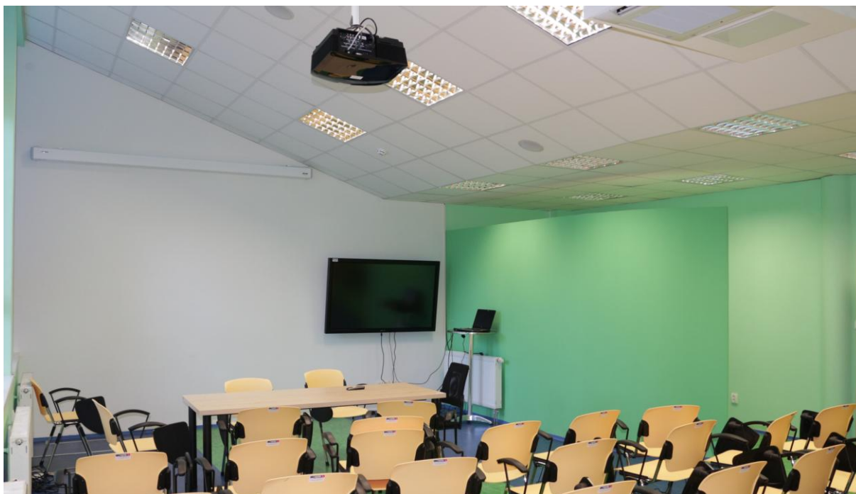
Obr. 7. Prezentačná miestnosť

Obsahom druhej časti boli práce na vytvorení prezentačného portálu, ktoré boli realizované dodávateľsky spoločnosťou SOITRON s.r.o. Zmyslom portálu je prezentovať digitálne výstupy projektu širokej verejnosti.