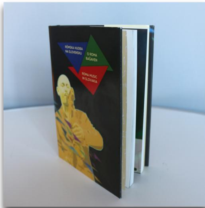
Obr. 9. Rómska hudba na Slovensku

Rómska hudba je v podaní rómskych spevákov a hudobníkov zo všetkých oblastí rómskej kultúry najviac viditeľná. Rómske hudobné dedičstvo zahŕňa stáročnú tradíciu interpretov hudby a skladateľské počiny samotných rómskych umelcov, preto zber hudobného materiálu bol počas projektu dominantný a smeroval k vytvoreniu multimedialnej knihy o hudbe . Kniha je trojjazyčná – slovenská, rómska a anglická a pojem multimedialna predstavuje ukážky spevu, hudby a tanca, ktoré knižnica získala a spracovala vo forme knihy a DVD nosiča tak, aby priblížila rómske hudobné umenie čo najširšej verejnosti.