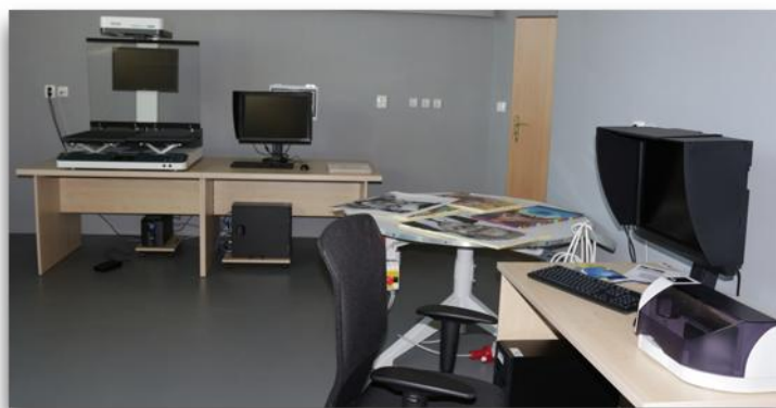
Obr. 5. Digitalizačné pracovisko