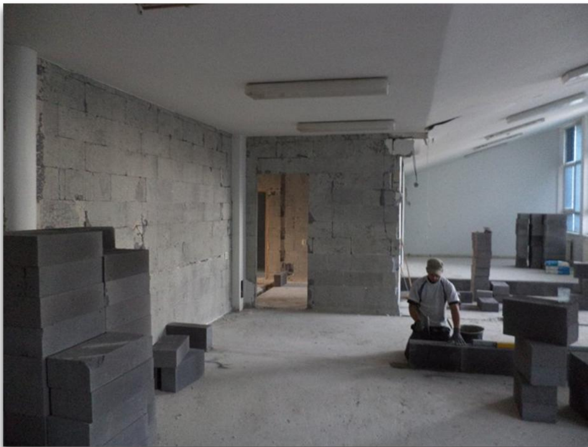
Obr. 1. Rekonštrukcia – interiér

na uloženie dátových nosičov, stôl na digitalizovanie 2D objektov, šatníkové skrinky s elektronickým zámkom na otváranie prostredníctvom knižnicou vydaného knižničného pasu. Dodaním tohto vybavenia, ktoré zabezpečila bratislavská spoločnosť FORSTER archívna a dopravná technika, s.r.o. v obstaranej sume 53 000 €, bola ukončená aktivita č. 1.