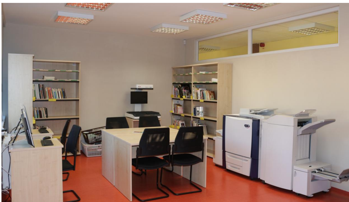
Obr. 4. Študovňa