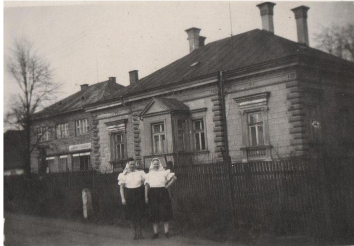
Obrázok 4 Fotografia domu z obdobia okolo roku 1945