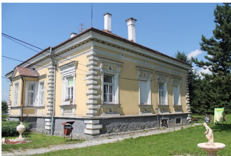
Obrázok 10 Dom v súčasnosti

Dom sa začal využívať na prenájom a z prenájmu sa financovali drobné opravy na dome. Sídľili v ňom viaceré obchody. V roku 2010 bola zateplená veranda, pôvodné drevené okná boli odstránené a boli nahradené plastovými. Aby sa zabránilo zatekaniu dažďovej vody do pivnice, nad vonkajšie schody do pivnice pribudol drevený prístrešok.