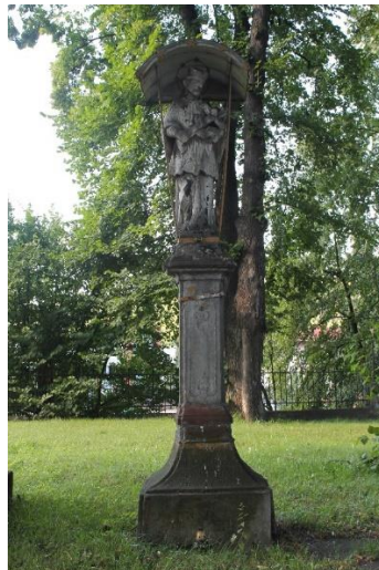
Obrázok 9 Socha Jána Nepomuckého

Do konca 70. rokov 20. storočia bola pred domom umiestnená Socha Jána Nepomuckého. Bolo to pri štátnej ceste, socha bola otočená smerom ku rieke Čierňanke. Ján Nepomucký je patrónom spovedného tajomstva a ochrancom pltníkov, pocestných, mlynárov a lodiarov. Ochráňuje ľudí pri prírodných pohromách a povodniach. Na zadnej strane sochy sme objavili vyrytý rok 1821. Tento letopočet je taktiež zakódovaný v dnes už ťažšie čitateľnom nápise na podstavci sochy, jednotlivé slová sa podarilo identifikovať nasledovne: PRO GLORIA INFINITITNIS ZILVS. PIDILIS PLEBIS. CZATTZENSIS. POSVIT MI. Dôvod, prečo bola práve socha Jána Nepomuckého umiestnená na danom mieste ostáva neznámy. Môžeme sa len domnievať, že tak urobili „ľudia čadčianski“ = „PLEBIS CZATTZENSIS“ a bolo pri príležitosti stého výročia blahorečenia Jána Nepomuckého, ktoré sa uskutočnilo 31. mája 1721. Socha bola neskôr, krátko pred výstavbou autobusového nádražia, premiestnená ku Kostolu svätého Bartolomeja v Čadci. Pri premiestňovaní prelomila na dve časti. Socha je chránenou pamiatkou.