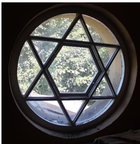
Obrázok 8 Okno v tvare Dávidovej hviezdy

Počas prestavby v roku 1929 budova prešla aj ďalšími úpravami. Pôvodná strecha bola vymenená za plechovú. Čiastočne alebo úplne boli zamurované niektoré okná na južnej a severnej strane domu. Na západnej strane domu na mieste bývalého vstupu do domu vznikol výklenok. Strecha nad vchodom a schodiskom bola odstránená. Namiesto toho na jej mieste, nad verandou, pribudlo okno kruhového tvaru s priemerom približne jeden meter, v ktorom sa nachádza symbol Dávidovej hviezdy. Toto okno, možno aj symbolicky, smeruje na východ. Za vlastníctva Aloisa Rufeisena pribudli aj kovové ozdoby na vchodových dverách a v ornamente nad vchodovými dverami sa nachádzajú jeho prepletené iniciálky AR. Ďalším zaujímavým a cenným detailom sú sklá, konkrétne sklá na vchodových dverách, ďalej na dverách do kuchyne, kúpeľne a toalety a na okne v kúpeľni. Toto sklo má na sebe vzor s arabeskovými hviezdami s krížmi. S veľkou pravdepodobnosťou toto sklo bolo aj na okne s Dávidovou hviezdou.