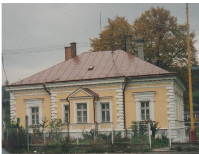
Obrázok 7 Budova 195 po rekonštrukcii v roku 1996