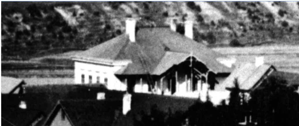
Obrázok 1 Detail pohľadnice z roku 1898